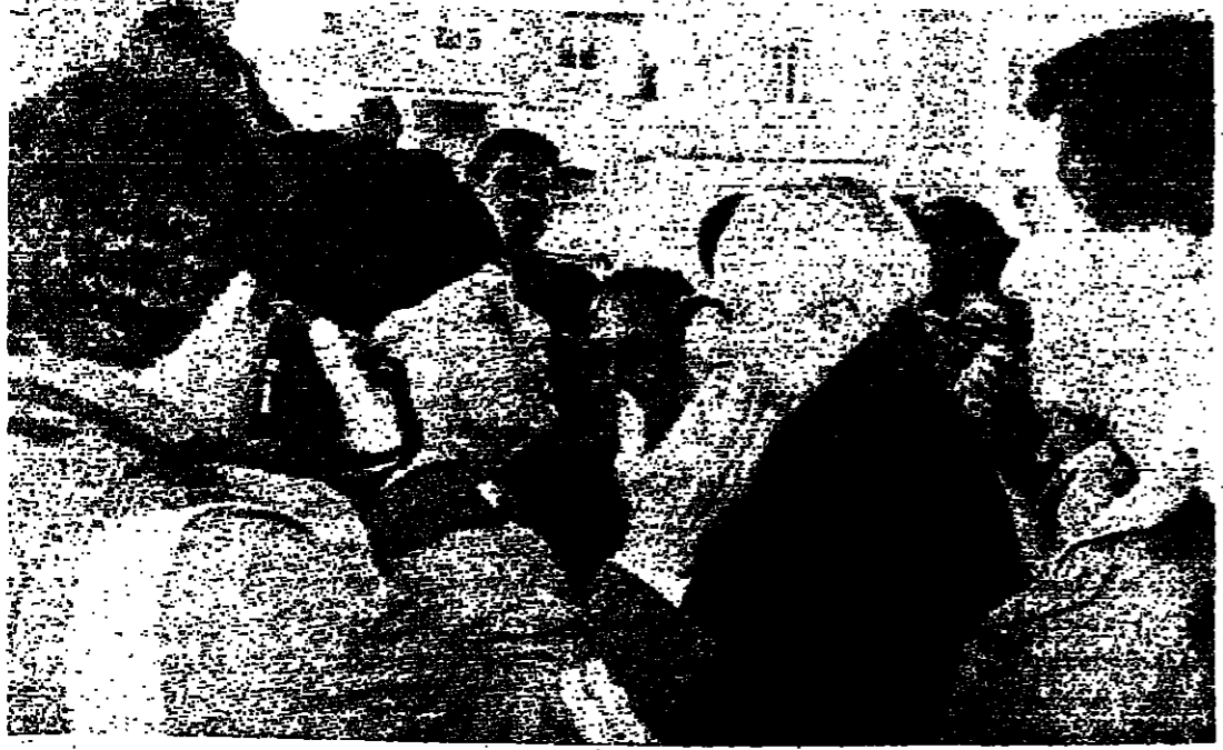
الرئيس سلام وعيران في صيدا